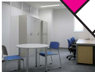
●メインインキュベートルーム