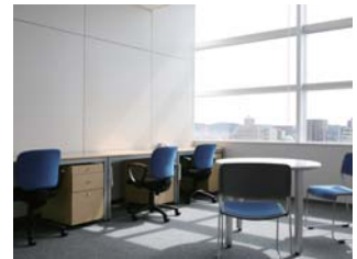
●ポストインキュベートルーム